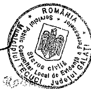
Cărăbăș Florela Răduț Ofițer de stare civilă